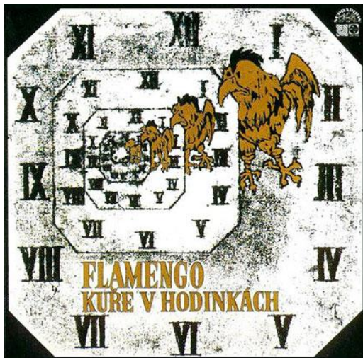
Příloha 6: Původní přední obal LP Kuře v hodinkách skupiny Flamengo z roku 1972.