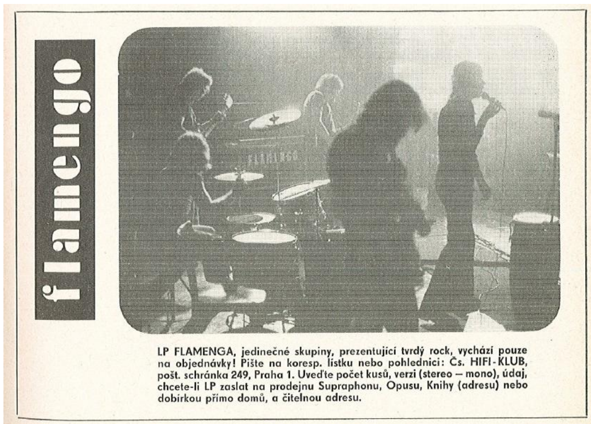
Příloha 4: Reklama na LP Kuře v hodinkách skupiny Flamengo (1972, s. 27)

soiny! Čas to je kuře v hodinkách Čas je jen sedl e a cedryph urdoh