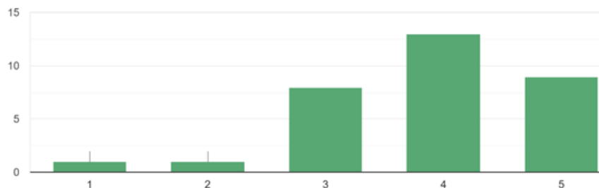
Jak jste spokojeni s organizací praxe na fakultě?