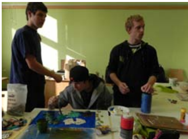
Prostorová práce v ateliéru na Pedagogické fakultě MU