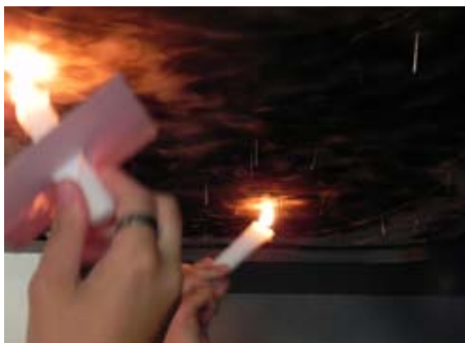
Malba ohněm přes šablonu