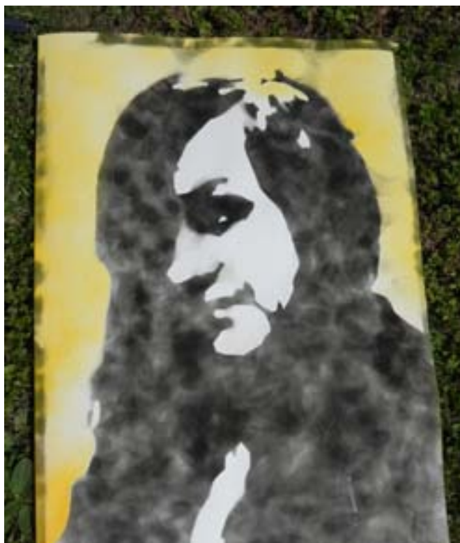
Výsledný obraz po opalování ohněm