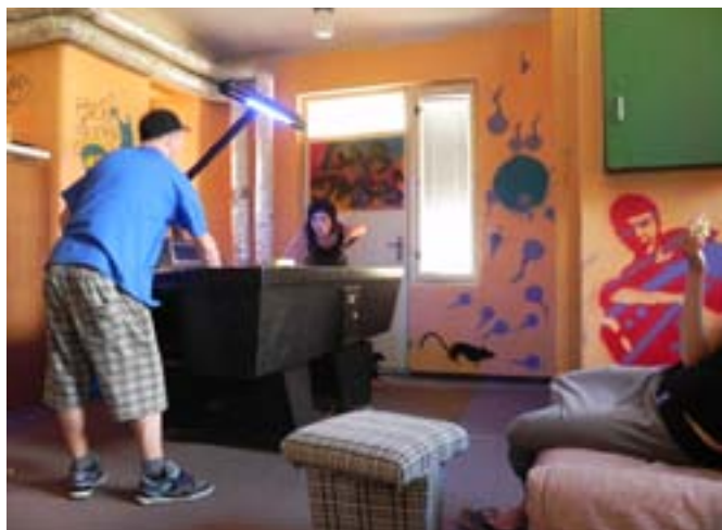
Projekt zaměřený na grafity / místnost „čajovny“ v DÚM