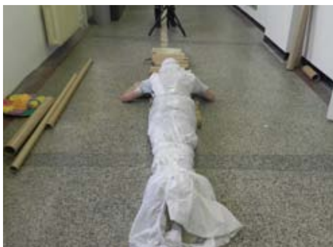
Akce s trubkami / performance na chodbě Pedagogické fakulty MU (červ)