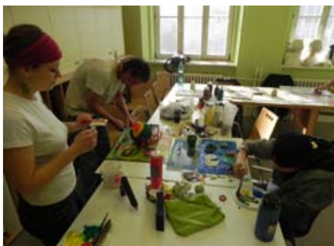
Prostorová práce v ateliéru na Pedagogické fakultě MU