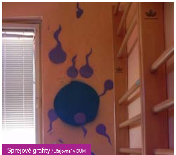
Sprejové grafity / „čajovna“ v DÚM