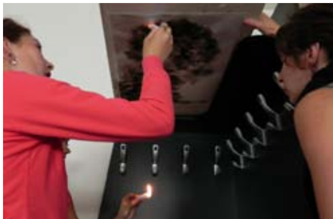
Malba ohněm přes šablonu

Na začátku jsme ukazovali možnosti, ukázky, vysvětlovali techniku. Ale možná jsme trochu podcenili úvod. Mohli jsme je víc motivovat, povykládat jim víc o street artu. Je potřeba víc myslet na motivaci, být pohotový, připravení na to, že se nálada může změnit a že se s tím musí něco udělat. Je potřeba myslet na vytváření příjemné atmosféry.