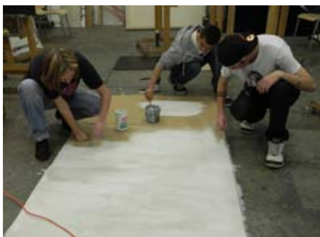
Příprava velkého grafity v ateliéru na Pedagogické fakultě MU