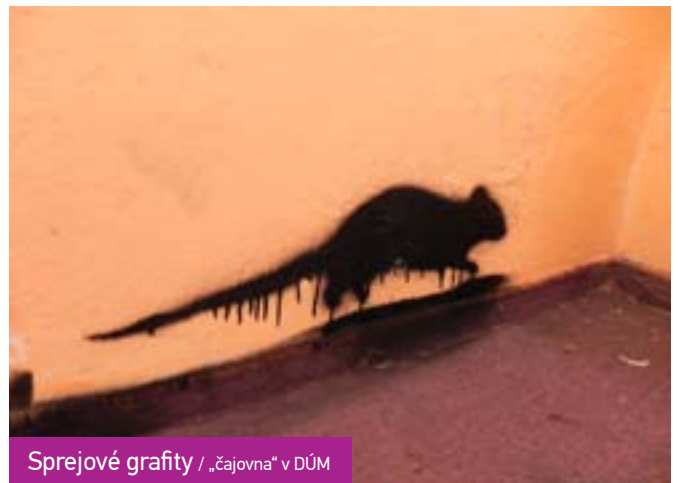
Sprejové grafity / „čajovna“ v DÚM