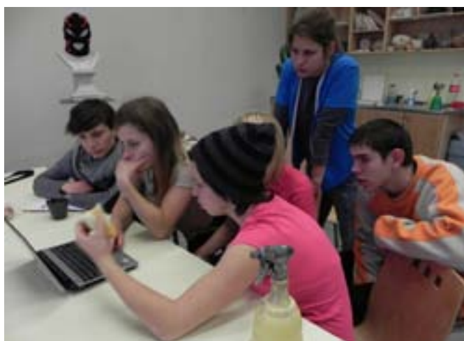
Projekt Aargh!!! / tvorba komiksového příběhu