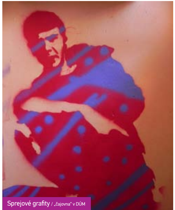
Sprejové grafity / „čajovna“ v DÚM

Holky posunuly samy od sebe práci se šablonou a opalování ohněm dál. Šablony začaly vysypávat jehličím a dalším materiálem. Vznikla zajímavá řada portrétů, vytvořených na zemi. V tomto směru, tj. na využití jiného materiálu, než jen sprejů, by se dalo pracovat dál.