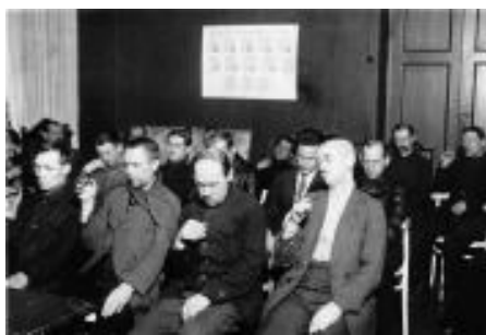
V. M. Bechtěrev při práci se zhypnotizovanými alkoholiky