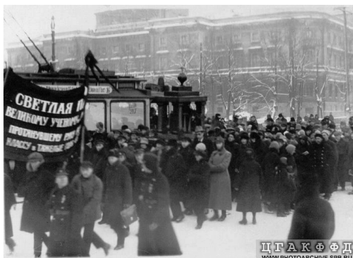
Urna s popelem V. M. Bechtěreva a smuteční průvod, doprovázející urnu po nábřeží řeky Něvy