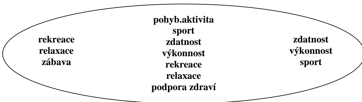
Obr. 1 Názory učitelů na funkci TV - obsahové rozpětí kategorizovaných odpovědí

Obsahové rozpětí a četnost vymezených kategorií jsou vyjádřeny také graficky (obr. 1, graf 1). Tento výsledek patrně není optimálním východiskem pro plošné plnění deklarovaných zdravotně orientovaných cílů tělesné výchovy a výchovy ke zdraví.