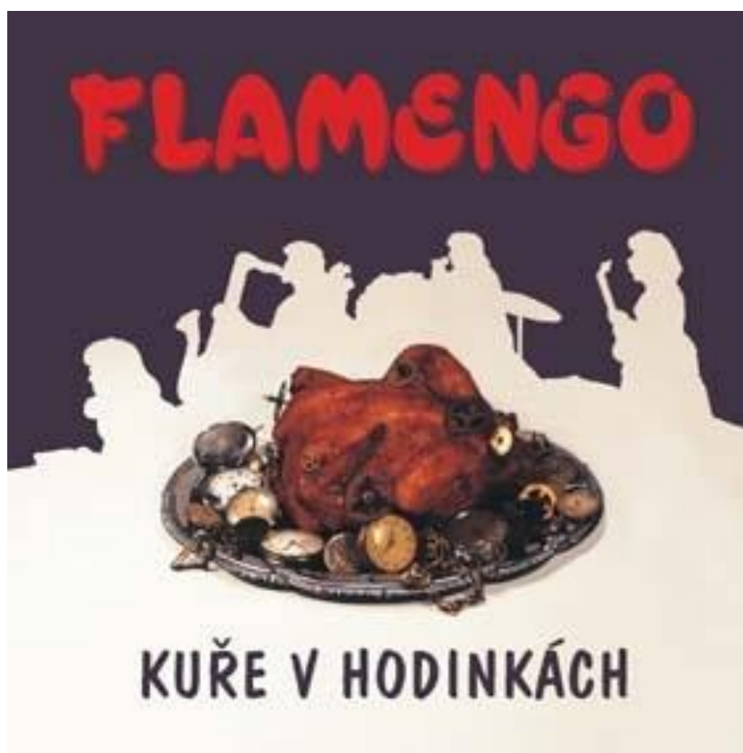
Příloha 8: Přední obal CD Kuře v hodinkách skupiny Flamenco z roku 1999.