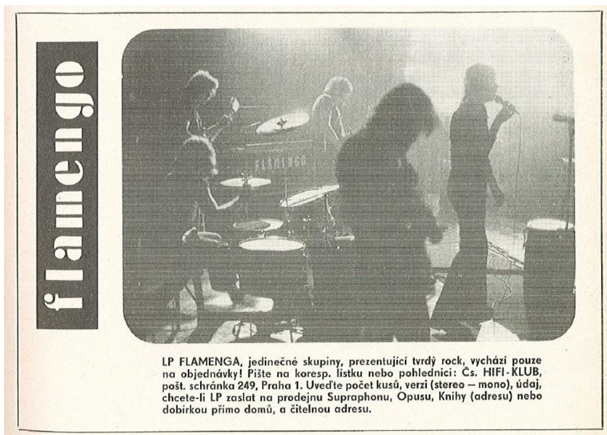
Příloha 4: Reklama na LP Kuře v hodinkách skupiny Flamengo (1972, s. 27)

soiny! Čas to je kuře v hodinkách Čas je jen sedl e a cedryph hrdok