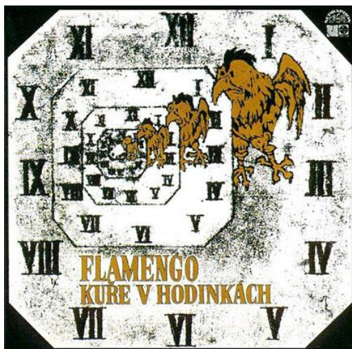
Příloha 6: Původní přední obal LP Kuře v hodinkách skupiny Flamenco z roku 1972.