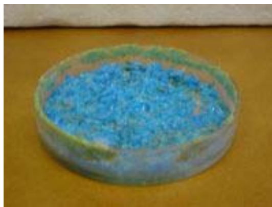
Krystalizace za prudkého ochlazení a míchání.