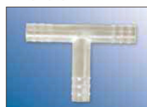
T-spojky hadic PP