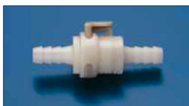
Rychlospojky hadic bez ventilů