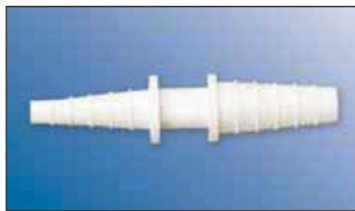
Spojky hadic PP redukční