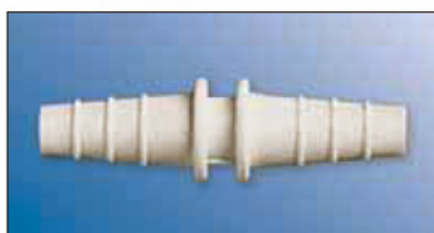
Spojky hadic PP