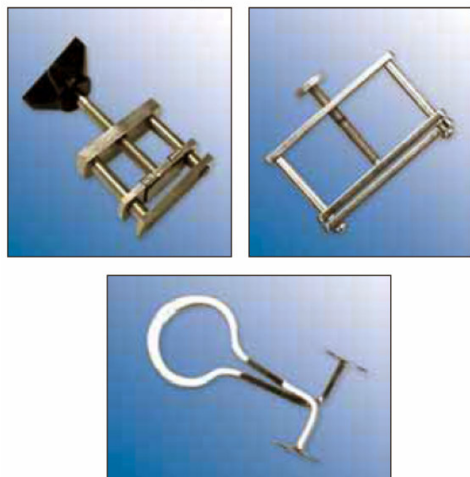
Tlačky na hadice