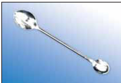
Lžička chemická oboustranná