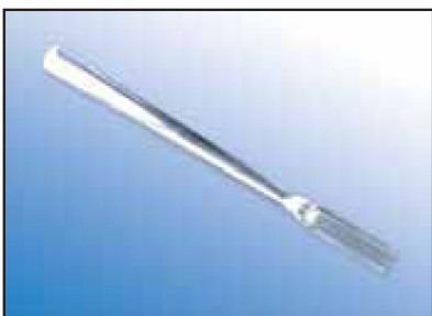
Lžička na práškové materiály