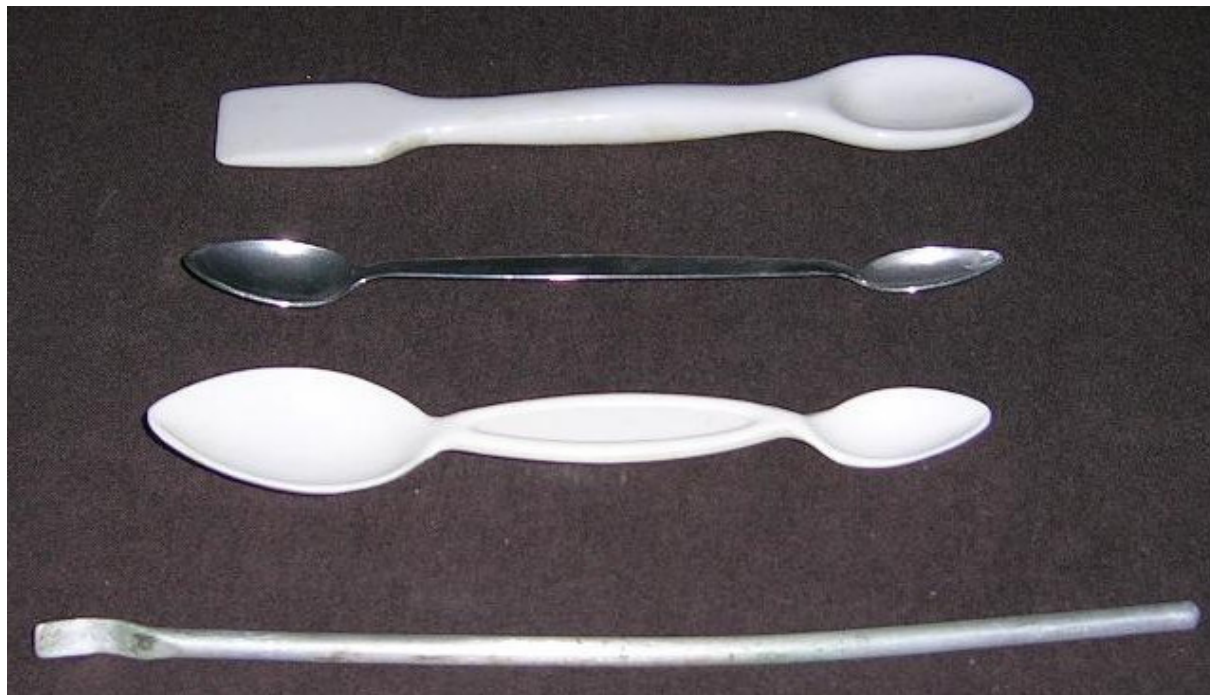
Špachtle oboustranná nerezová

používáme při navažování pevných látek. Podle účelu použití se vyrábějí v různých velikostech, tvarech a z různých materiálů (nerez, porcelán, plast).