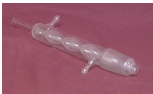
Chladič k Soxhletovu extraktoru