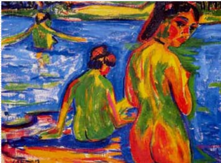
Ernst Ludwig Kirchner, Koupající se dívky 1909 (Ragazze che si bagnano)