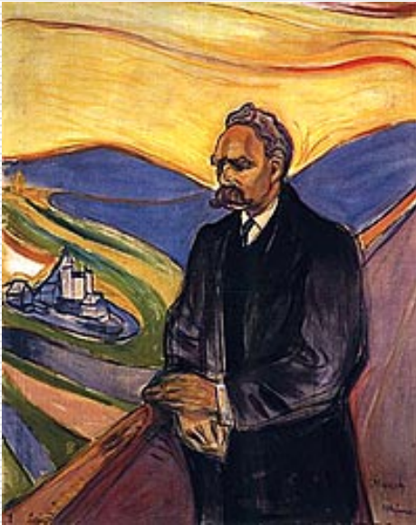
Emil Nolde, Friedrich Nietzsche 1906

El Greco, Cézanne („magnus parens“), Daumier, současné francouzské moderní a německé umění, orient, primitivismus, baroko, renesance. Z literatury to byli především Tolstoj a Dostojevsky.