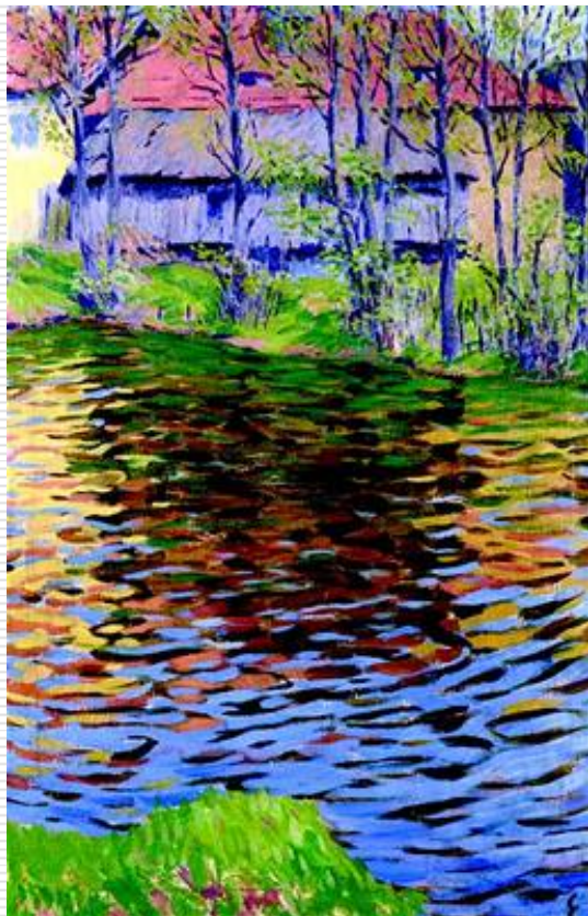
Emil Artur Pittermann-Longen, Dům u vody 1905

Pittermann měl své obrazy vystaveny ve výklenku zakrytém oponou a bylo je možné shlédnout jen na požádání, poněvadž byl dosud studentem Akademie.