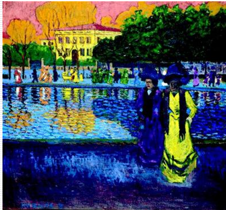
Bohumil Kubišta, Promenáda u Arna 1907