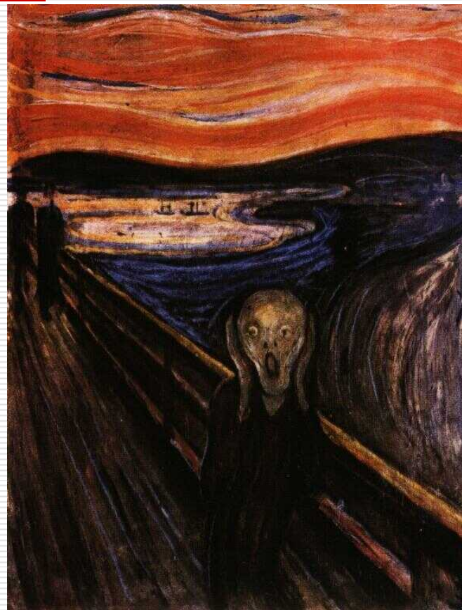
Edvard Munch, Výkřik 1893