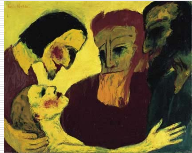
Emil Nolde, Hříšnice 1926 (Die Sünderin)