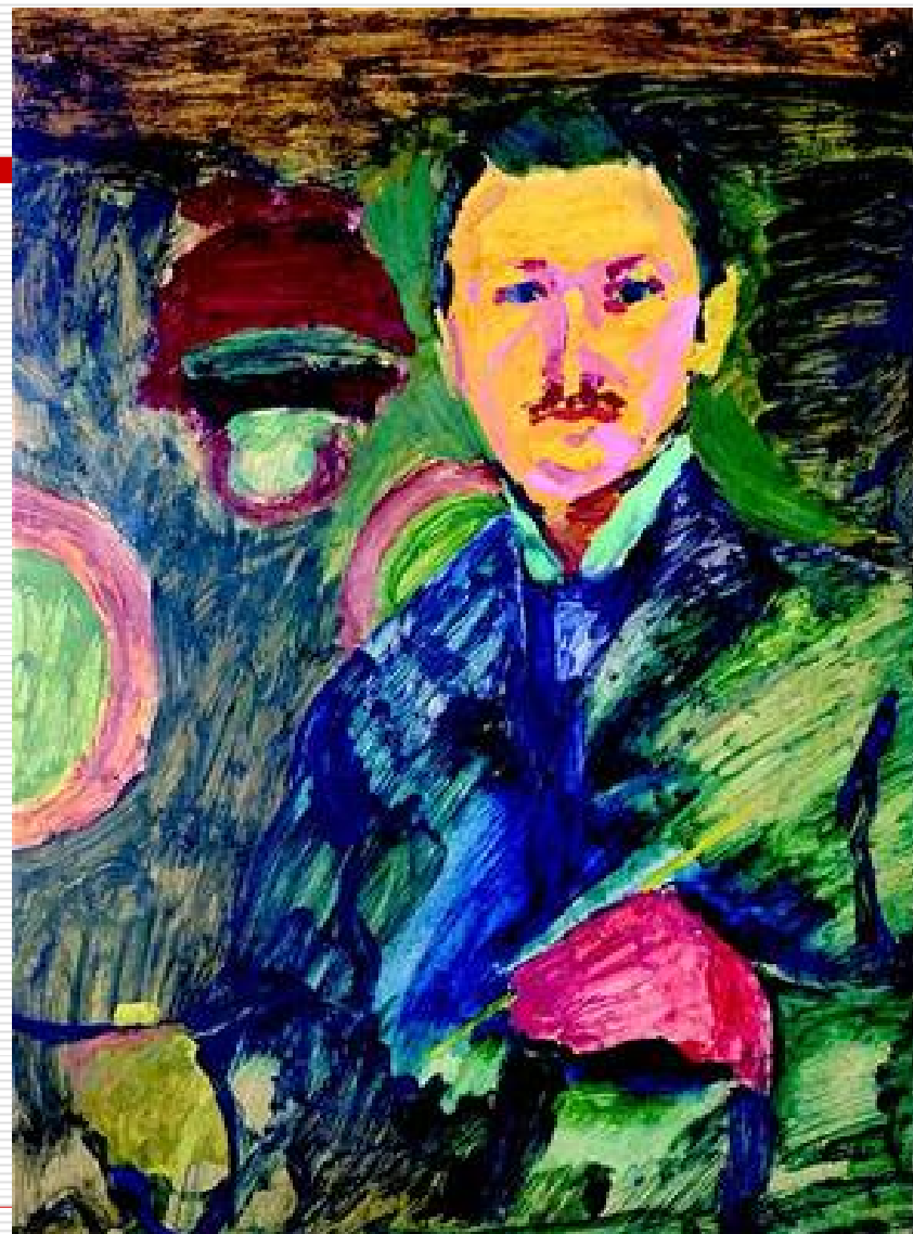
Emil Filla, Autoportrét 1907