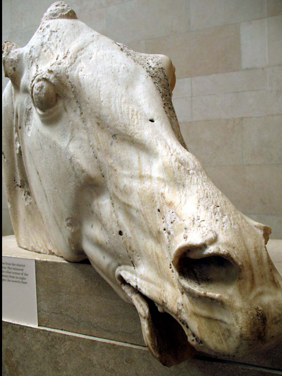
... from the charist ... the balanced ... other corner of the ... from its right- ... the nostrils flare