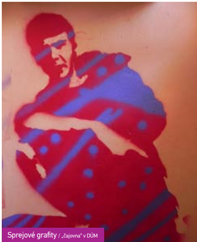
Sprejové grafity / „čajovna“ v DÚM

Holky posunuly samy od sebe práci se šablonou a opalování ohněm dál. Šablony začaly vysypávat jehličím a dalším materiálem. Vznikla zajímavá řada portrétů, vytvořených na zemi. V tomto směru, tj. na využití jiného materiálu, než jen sprejů, by se dalo pracovat dál.