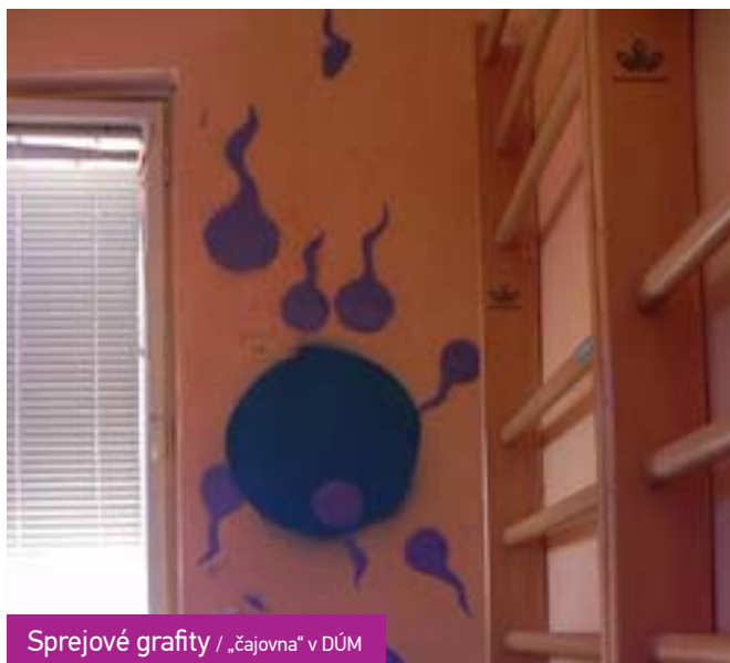
Sprejové grafity / „čajovna“ v DÚM