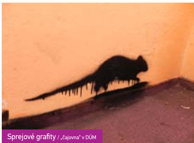
Sprejové grafity / „čajovna“ v DÚM